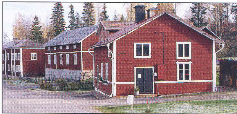
Endast en liten skylt avslöjar att det enkla huset rymmer Borns bryggeri.

För att få den rätta bruna färgen tillsätts sockerkulör.