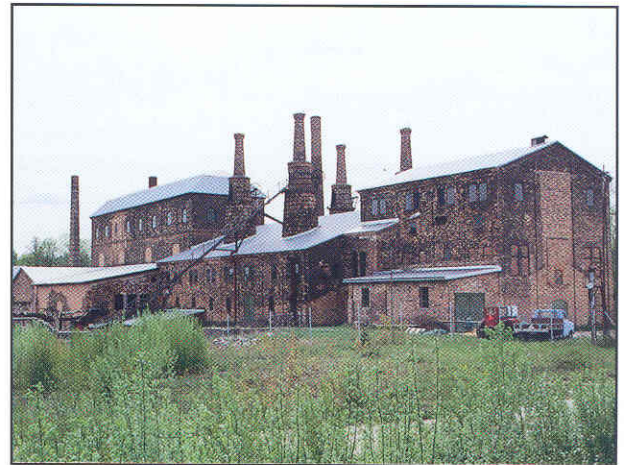
Hyttan vid Forsbacka järnverk.

Diplomet delas ut vid Brukets dag i Forsbacka den 12 juni.