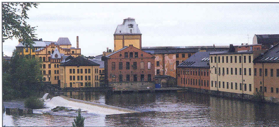
Bergs bomullsfabriker vid Strömmen i Norrköping.

Svenska industriminneföreningen kommer att finnas på plats för att dels hålla ett medlemsmöte, dels ett föredrag den 24 mars. Kersti Morger kommer att föreläsa om TICCIH:s verksamhet och ge exempel på internationella projekt där man arbetat med industrianläggningar och deras bevarande.